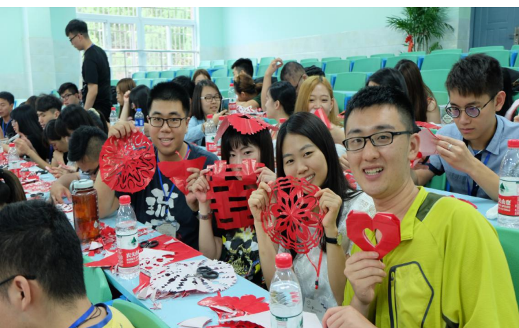
民間藝術-剪紙講座研習