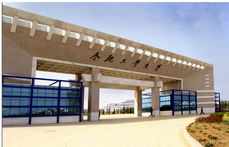
合肥工業大學翡翠湖校區大門

學校與香港中文大學、香港理工大學、香港科技大學、澳門大學、臺灣大學、清華大學、臺灣師範大學、臺灣科技大學、中山大學、佛光大學、中國文化大學、逢甲大學、義守大學、靜宜大學、雲林科技大學等多所港澳臺高校進行校際合作與師生交流，每年互訪人數達到百人次。學校每年組派管理師資團隊，赴臺灣進行專題培訓與學習；每年暑期，由學校港澳臺事務辦公室主辦，舉行兩岸四地大學生徽文化研習營活動；每學期，與臺灣合作高校互派交換生。