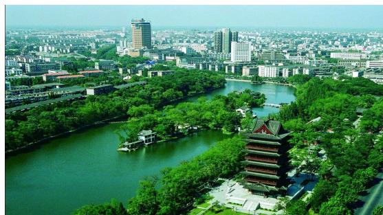
合肥環城翡翠-包河