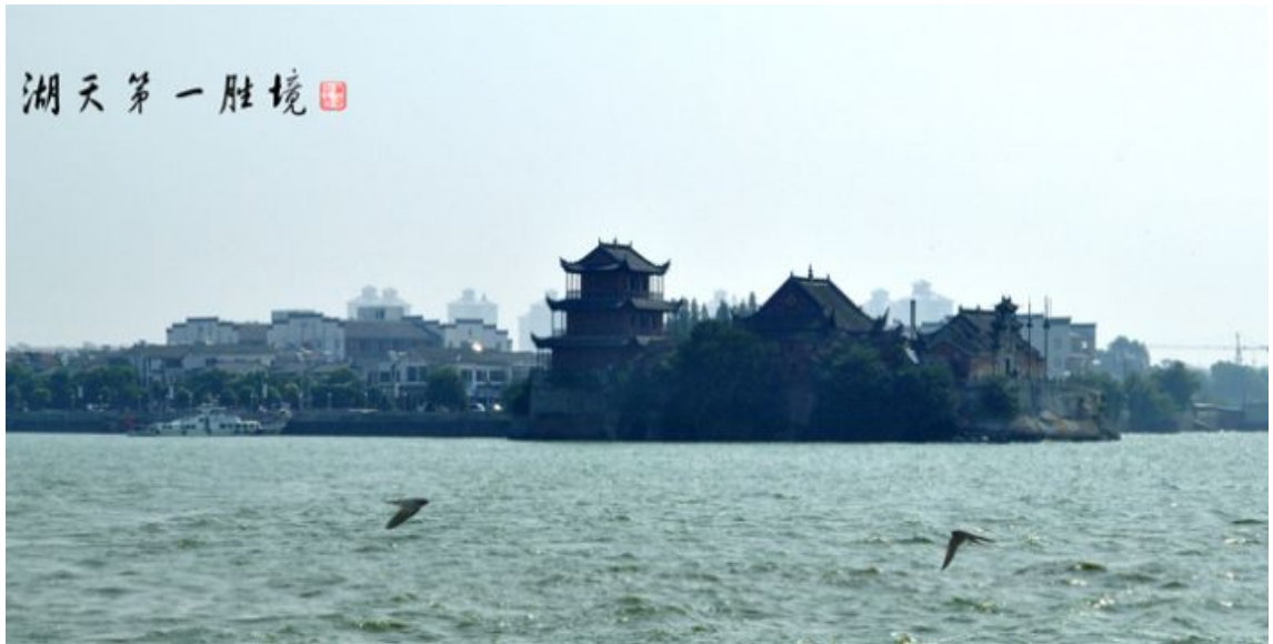
湖天第一勝境——安徽巢湖