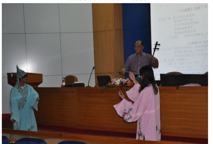
非物質文化遺產-黃梅戲講座表演