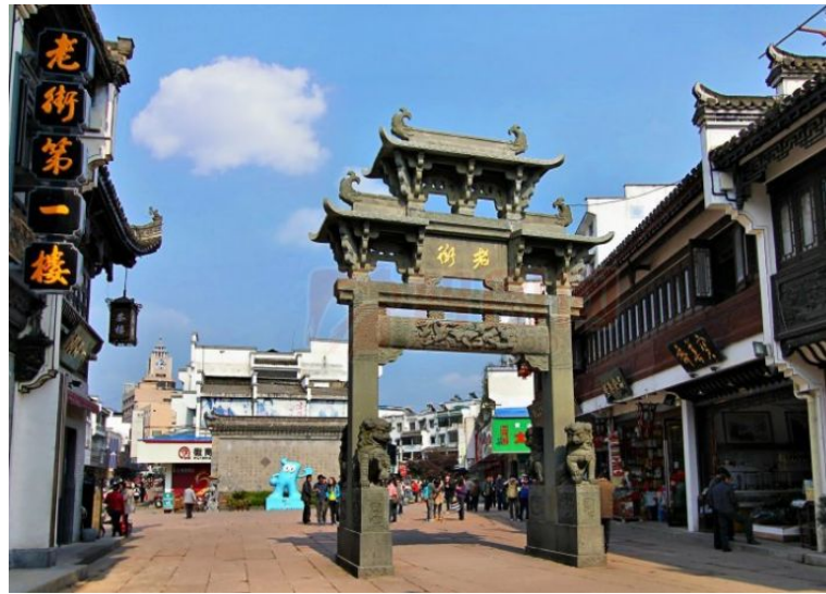
徽州古道-屯溪老街