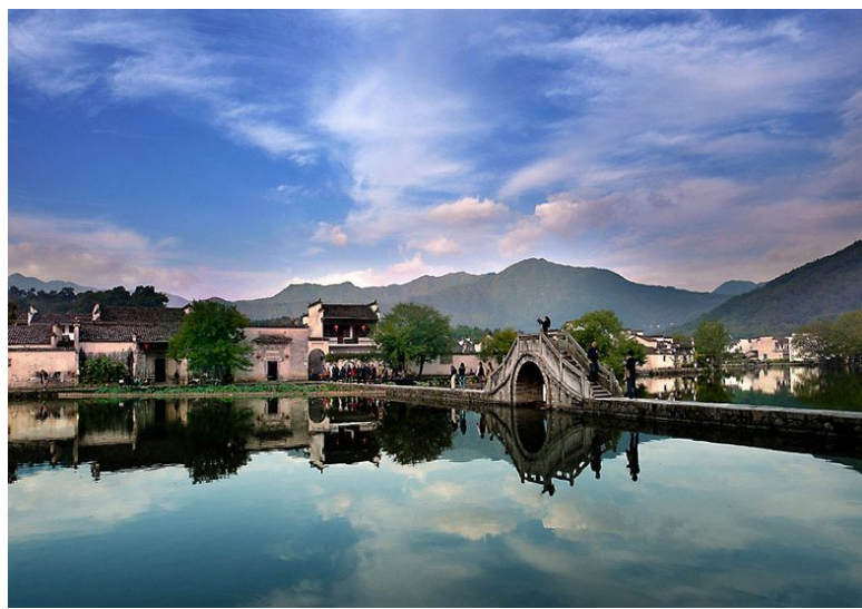
電影拍攝地-屯溪宏村