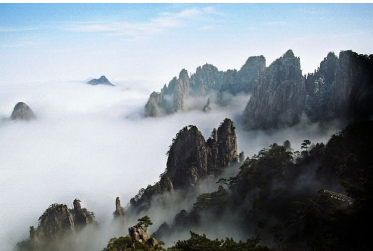
世界地質公園-黃山