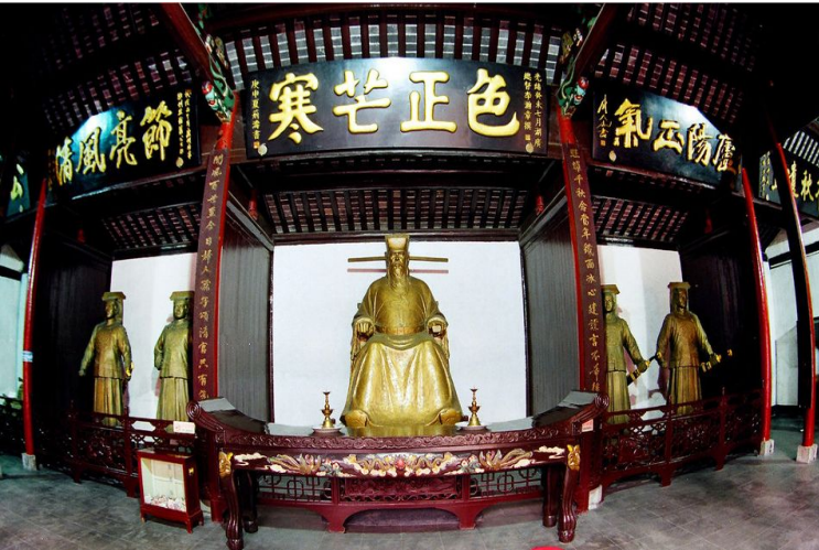
宋代名臣包拯祠堂