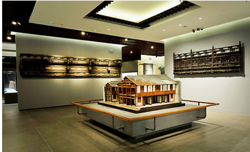
皖風徽韻-安徽省博物院