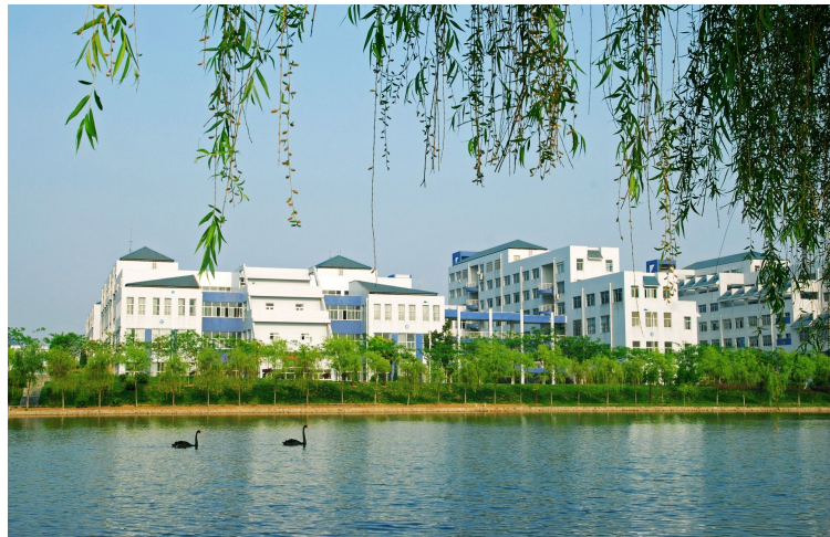
翡翠湖校區教學樓