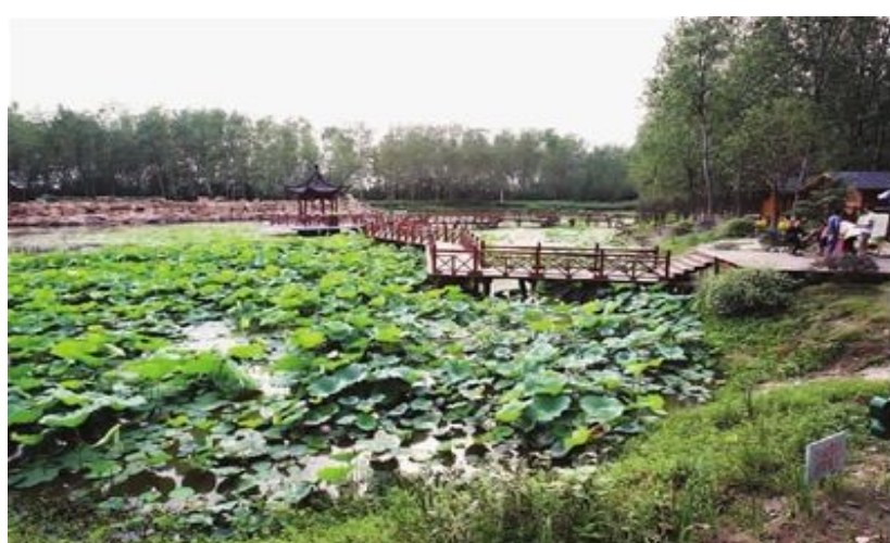
天然氧吧-濱湖濕地森林公園