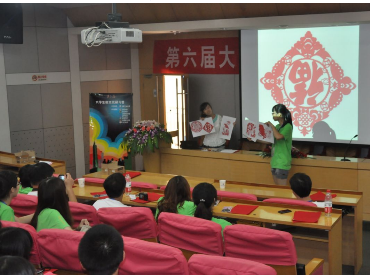
民間藝術-剪紙講座研習