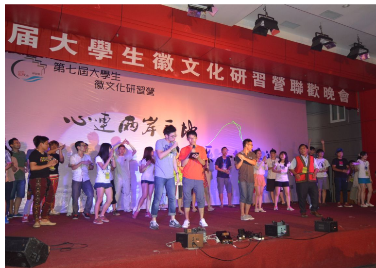
兩岸四地大學生聯歡會