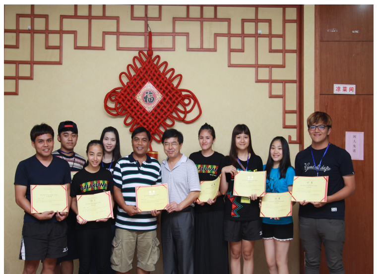
結營典禮頒發證書