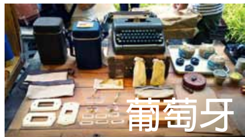
任務：44個里斯本詩人景點 旅行家 歐陽哲芬-清華大學大中文系

129個旅行家們回來了！其中4個將現身清華大學分享親身經歷的異國故事，訴說旅行前後的成長與蛻變，走出台灣，就在今年，舍我其誰？