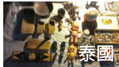
任務：Chatuchak巨型周末市集 旅行家 黃映婷- 清華大學科技管理所